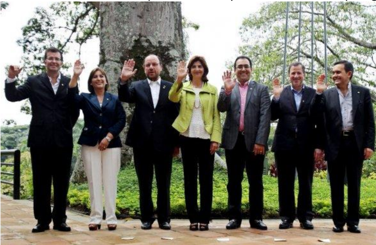
Ministros de Comercio y de Exteriores de Perú, Chile, Colombia y México posan para la tradicional fotografía oficial de la cumbre de cancilleres, ayer en Cali, Colombia.

Paraguay, bienvenido a bloque regional, a pesar de Itamaraty -- La VII Cumbre de la Alianza del Pacífico, integrada por Colombia, Chile, Perú y México, reúne esta mañana a sus presidentes en Cali para apuntalar el bloque y aprobar, entre otros puntos, el ingreso de Paraguay como miembro observador. Un fuerte respaldo de la delegación de México y el fracaso del lobby brasileño contra nuestro país dieron impulso a la adhesión paraguaya al bloque regional.